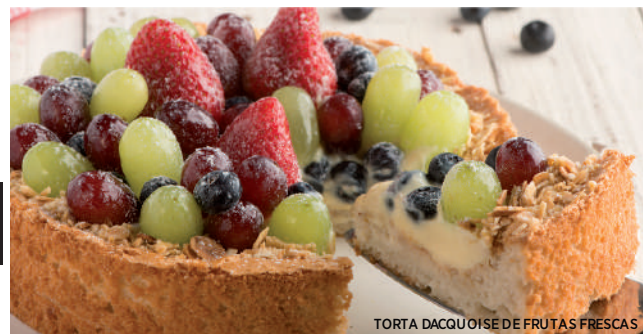
TORTA DACQUOISE DE FRUTAS FRESCAS