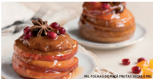
MIL FOLHAS DE MAÇÃ FRUTAS SECAS E MEL