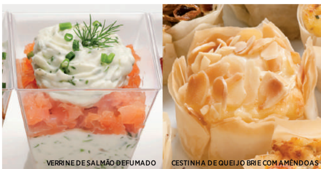
VERRINE DE SALMÃO DEFUMADO