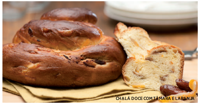
CHALÁ DOCE COM TÂMARA E LARANJA