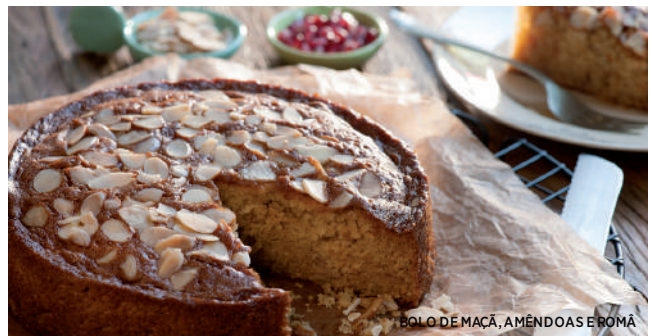
BOLO DE MAÇÃ, AMÊNDOAS E ROMÃ