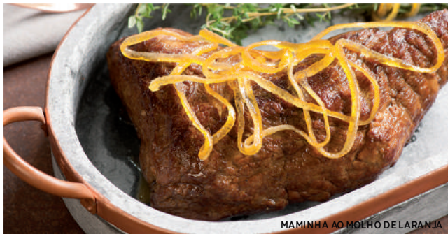
MAMINHA AO MOLHO DE LARANJA