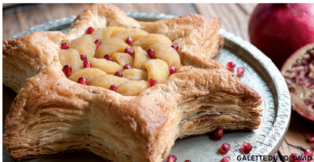
GALETTE DU ROI DAVID